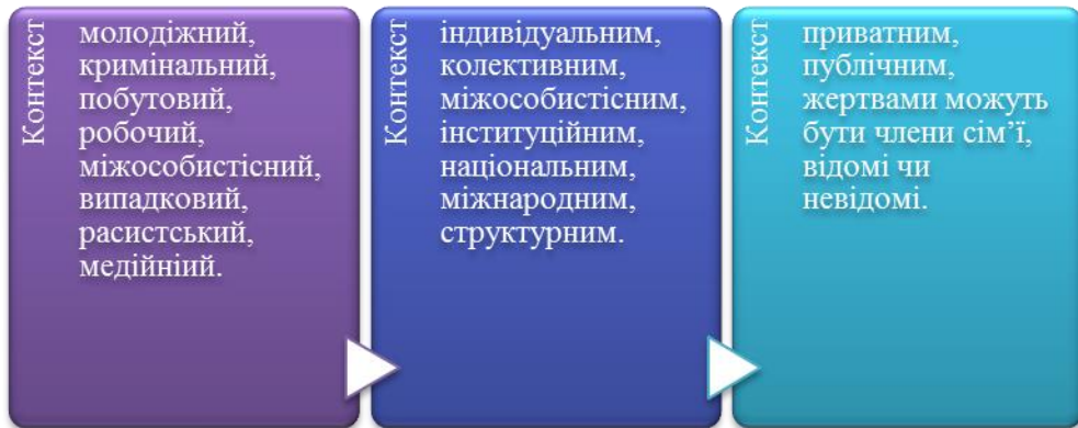
Таблиця 2: Різновиди насильства.