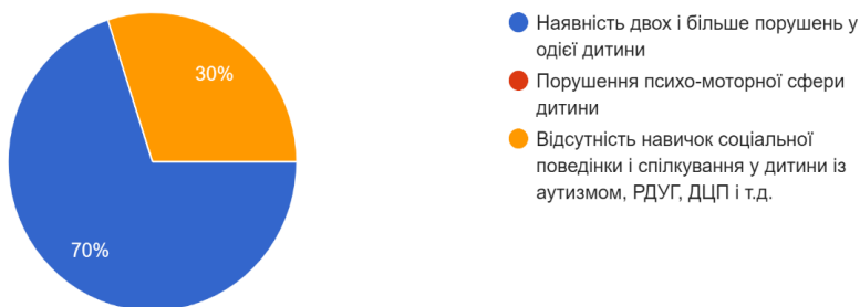
Рис. 3. Складні порушення розвитку дитини (після навчання).

Щодо дефініції «соціальна компетентність дитини зі СПР», на початку навчання, більшість слухачів (75%) розуміли це поняття як «уміння обслуговувати себе», «гігієнічні навички», «здатність дитини ефективно виявляти особистісні соціальні почуття, якості». Після завершення навчання, показники істотно змінилися, 70% слухачів та слухачок, правильно визначили даний термін у тестовій роботі (рис. 4). Розуміння педагогічними та соціальними працівниками феномену «соціальна компетентність» є вкрай важливим у роботі з дітьми зі СПР.