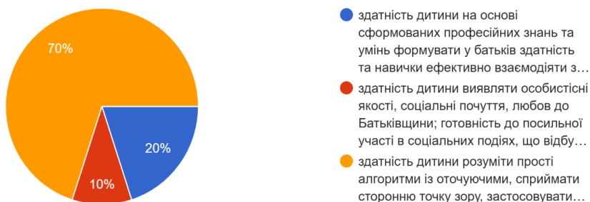
Рис. 4. Соціальна компетентність дитини зі СПР (після навчання).