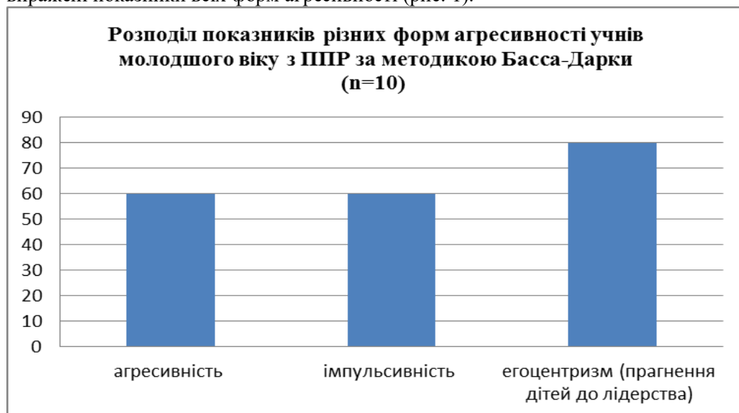
Рис. 1. Розподіл показників різних форм агресивності учнів молодшого віку з ППР за методикою Басса-Дарки

У випробуваних молодших школярів із ППР спостерігаються чітко виражені показники всіх форм агресивності (рис. 1).