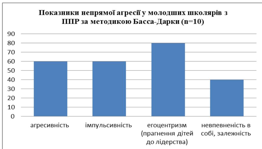
Рис. 2. Розподіл показників непрямой агресії у молодших школярів з ППР за методикою Басса-Дарки

У результаті використання методики «Неіснуюча тварина» було одержано дані, котрі свідчать про прояви агресивності в молодшому шкільному віці. Результати діагностики дітей із ППР за методикою «Неіснуюча тварина» показано на рис. 3.