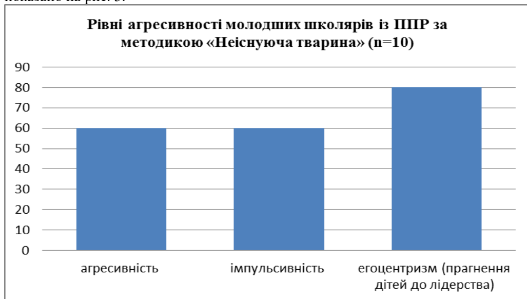
Рис. 3. Рівні агресивності молодших школярів із ППР за методикою «Неіснуюча тварина»

У результаті використання методики «Неіснуюча тварина» було одержано дані, котрі свідчать про прояви агресивності в молодшому шкільному віці. Результати діагностики дітей із ППР за методикою «Неіснуюча тварина» показано на рис. 3.