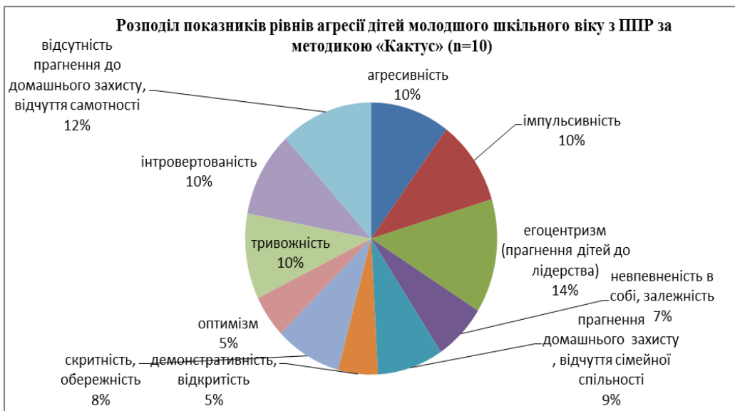
Рис. 4. Розподіл показників рівнів агресії дітей молодшого шкільного віку з ППР за методикою «Кактус» (n=10)

Про прояви агресивності дітей молодшого шкільного віку із ППР свідчать емпіричні показники, одержані в результаті використання методики «Кактус» (рис. 4).