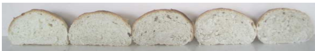
Контроль 1 2 3 4