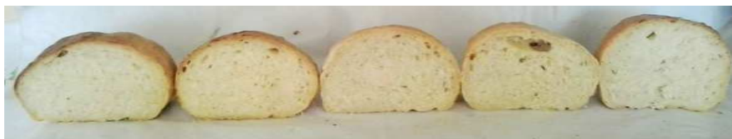
Контроль 1 2 3 4