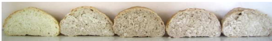
Контроль 1 2 3 4