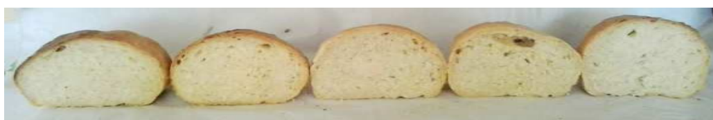
Контроль 1 2 3 4