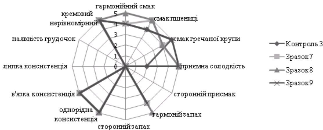
Рис. 3 – Загальна профілограма зразків пшенично-гречаних каш швидкого приготування збагачених стевіозидом

Всі зразки мали типову консистенцію, кремовий неоднорідний колір. Додавання стевіозиду покращило смакові властивості каш швидкого приготування, смак зразків став більш виражений та насичений. Зразок 7 мав недостатньо виражений, гармонійний смак та запах, однорідну, в'язку консистенцію. Зразок 9 у зв'язку з введенням 40 % гречаної крупи мав більш виражений смак гречаної крупи порівняно з контролем, однорідну, в'язку консистенцію, кремовий, неоднорідний колір, гармонійний аромат. Встановлено, що найкращим зразком був зразок 8, який в своєму складі містив 35% гречаної крупи, який мав гар-