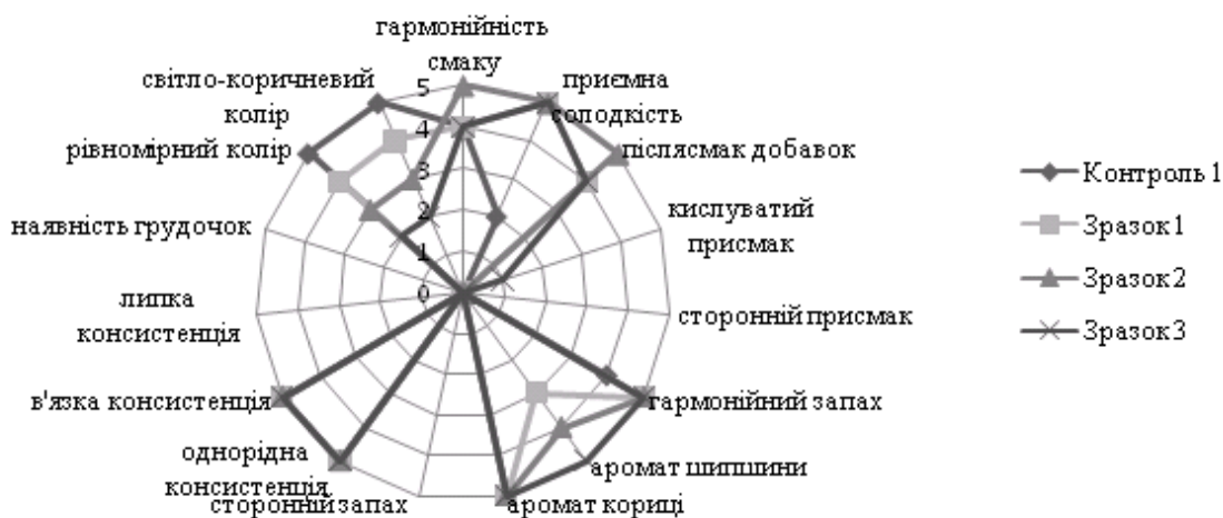
Рис. 1 – Загальна профілограма зразків каш швидкого приготування збагачених шипшиною, корицею та стевіозидом

Порівнюючи контроль 1 зі зразками 1, 2, 3, встановлено, що введення добавок поліпшило смак і аромат, зробивши їх більш привабливими, при цьому колір зразків став дещо неоднорідний, більш темний, консистенція контролю і зразків однакова. Зразок 1, із включенням 4 % шипшини, мав гармонійні, але недостатньо виражений смак та аромат добавок. Зразок 3 мав кислуватий присмак у зв'язку з внесенням 6 % меленої сухої шипшини, характерний, яскраво виражений аромат шипшини. Зразок 2 мав інтенсивний, гармонійний смак та запах, приємний післясмак застосованих добавок. Максимальні значення позитивних дескрипторів отримав зразок 2, із включенням 5 % меленої сухої шипшини, у зв'язку з цим цей зразок є найкращим.