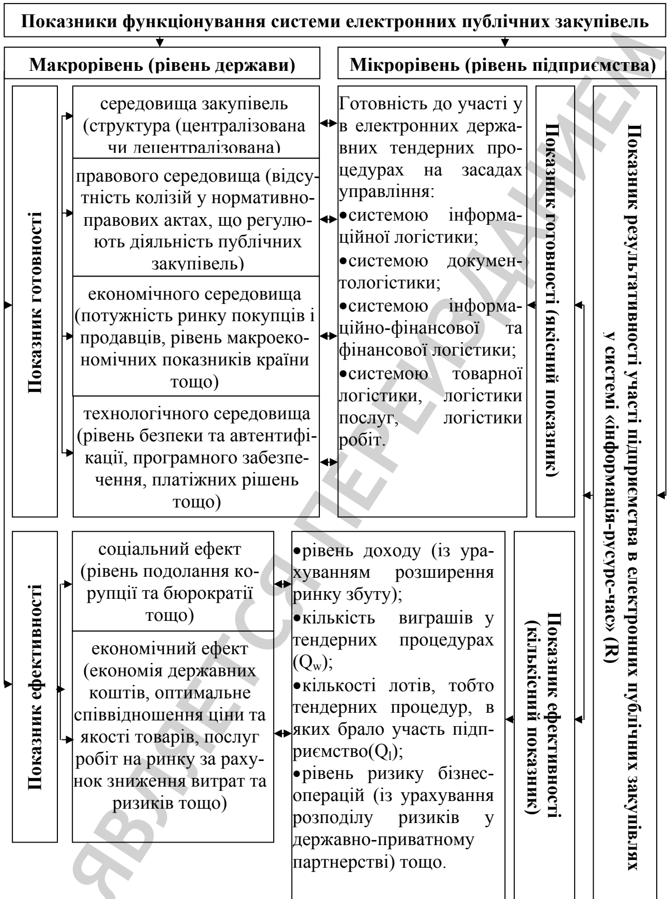
Рис. 2. Показники функціонування системи електронних публічних закупівель на макро- та мікрорівнях