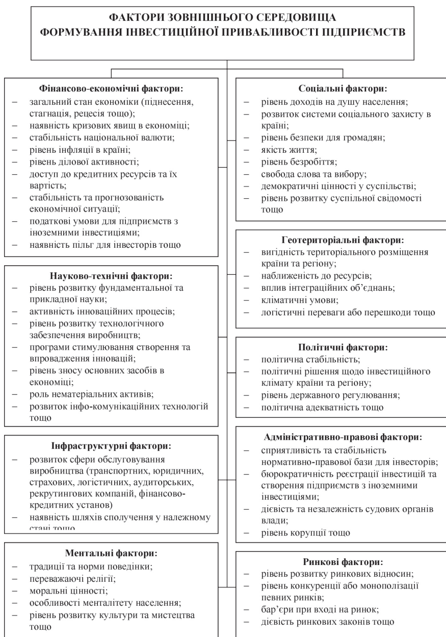
Рис. 1. Типологія факторів зовнішнього середовища формування інвестиційної привабливості підприємств (сформовано авторами)