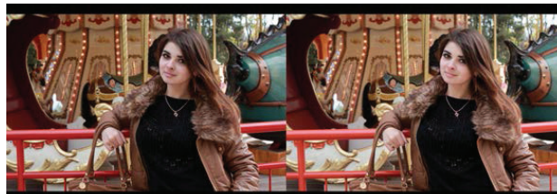
Рис. 2. Пример портрета с недостатком контрастности

Результат выполнения алгоритма представлен на рис. 2. Заметно, что тени на лице не настолько насыщены, как на левом изображении. Кроме того оно приобрело розоватый оттенок, что создает впечатление свежести и солнечности, атмосфера на фотографии лучше передана.