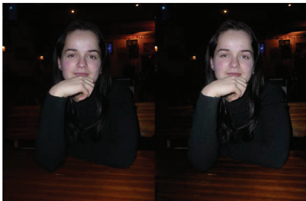
Рис. 1. Пример портрета с цветовыми дефектами

Для перевода файла в другое цветовое пространство следует использовать не просто Image > Mode, а команду Edit > Convert to Profile [6, 7]. При этом рекомендуется выполнять сведение слоев. Дело в том, что при переводе изображения, скажем, из RGB в CMYK корректирующие слои пропадают, если слои предварительно не объединить. Результаты наложения в новом пространстве могут оказаться пересчитанными самым неожиданным образом — это касается всех режимов, кроме Normal.