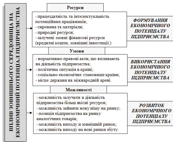
Рис. 1. Вплив зовнішнього середовища на процеси формування, використання та розвитку економічного потенціалу підприємства (авторська розробка)

ціалу регулюється законами країни, на території якої функціонує підприємство, суттєво залежить від рівня конкуренції в галузі, від політично-економічного стану держави, платоспроможності споживачів; можливість розвивати потенціал підприємства, використовувати перспективні можливості та ресурси також обумовлюється факторами зовнішнього середовища: наявністю або відсутністю суттєвих митних бар'єрів (при виході на зовнішній ринок), можливостями зайняти нову нішу на ринку, рівня науково-технічного та інтелектуального розвитку країни тощо. Особливості впливу зовнішнього середовища на процеси формування, використання та розвитку економічного потенціалу підприємства більш детально наведено на рис. 1.