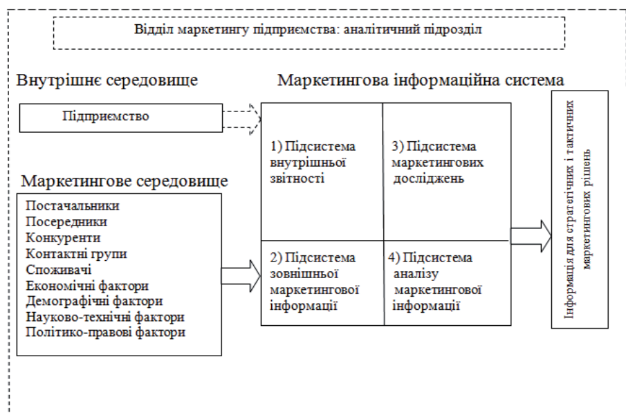
Рис. 1. Схема класичної концепції маркетингової інформаційної системи підприємства за Котлером Ф.: \cdots — дані бухгалтерського, статистичного, управлінського обліку; \Rightarrow — маркетингова інформація

Нові виклики, що стоять перед підприємствами, у тому числі перед підприємствами-виробниками бетону та виробів з бетону, в умовах зростання волатильності чинників маркетингового середовища обумовлюють необхідність формування неокласичної концепції маркетингових інформаційних систем.