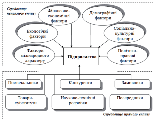
Рис. 1. Зовнішнє середовище підприємства

тання SWOT-аналізу. На основі даного методу в єдиній системі виміру одночасно порівнюються кількісні та якісні значення показників різного ступеню деталізації, що не може бути досягнуто шляхом відокремленого використання інших видів економічного аналізу. Однією з складових такого аналізу є оцінка стану зовнішнього середовища. Вся сукупність зовнішніх факторів, які оказують вплив на підприємство складається з факторів непрямого та прямого впливу (рис. 1).