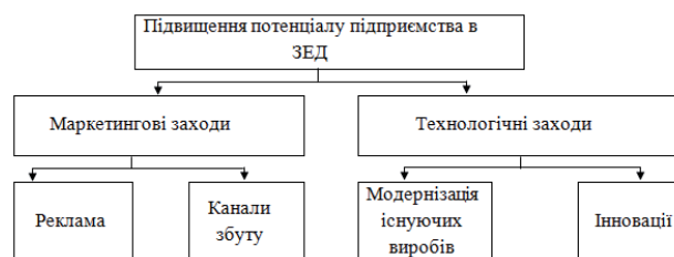
Рис. 2. Підвищення зовнішньоекономічного потенціалу підприємства

Аналіз стану та умов функціонування підприємств України показав, що за останні роки спостерігається падіння обсягів виробництва продукції, тому негативною тенденцією в діяльності вітчизняних підприємств є постійне зниження прибутку, а отже, і рентабельності виробництва [6]. Тому необхідно знаходити нові закордонні ринки збуту та застосовувати систему заходів щодо підвищення зовнішньоекономічного потенціалу підприємства (рис. 2).