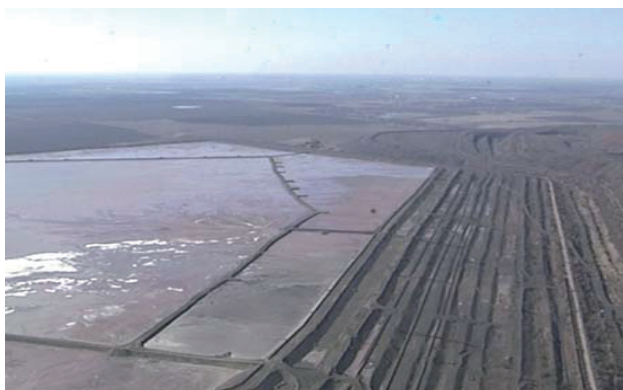
Рис. 2. Загальний вигляд хвостосховища ПАТ «Північний гірничо-збагачувальний комбінат»

На рис. 2 подано загальний вигляд одного з найбільших хвостосховищ Криворіжжя — хвостосховища ПАТ «Північний гірничо-збагачувальний комбінат».