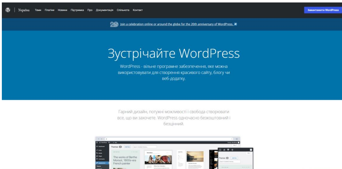
Мал. 2. Офіційний сайт WordPress.

Розпаковувати архів краще одразу в потрібну нам директорію. Це папка domains в папці OSPanel , створеній після встановлення OpenServer . За замовчування всі файли, необхідні для роботи з WordPress упаковані в папку з такою ж назвою. Можна залишити все як є, або змінити назву папки (та нашого сайту одночасно) на зручну. Тепер потрібно запустити свій локальний сервер OpenServer . В треї вашої операційної системи з'явиться іконка у вигляді червоного прапорця. Клік по ній відкриє меню локального сервера. Вам потрібно його запустити кліком по відповідному пункту з зеленим прапором. Після запуску будуть доступні такі пункти меню, як "Перезапустити" з жовтим прапором та "Зупинити" з червоним прапором. Вони необхідні відповідно для перезапуску сервера у випадку будь-яких змін в налаштуваннях або його зупинки при завершенні роботи. Також нам знадобляться пункти "Мої сайти" та в блоці "Додатково" пункт PHPMyAdmin .