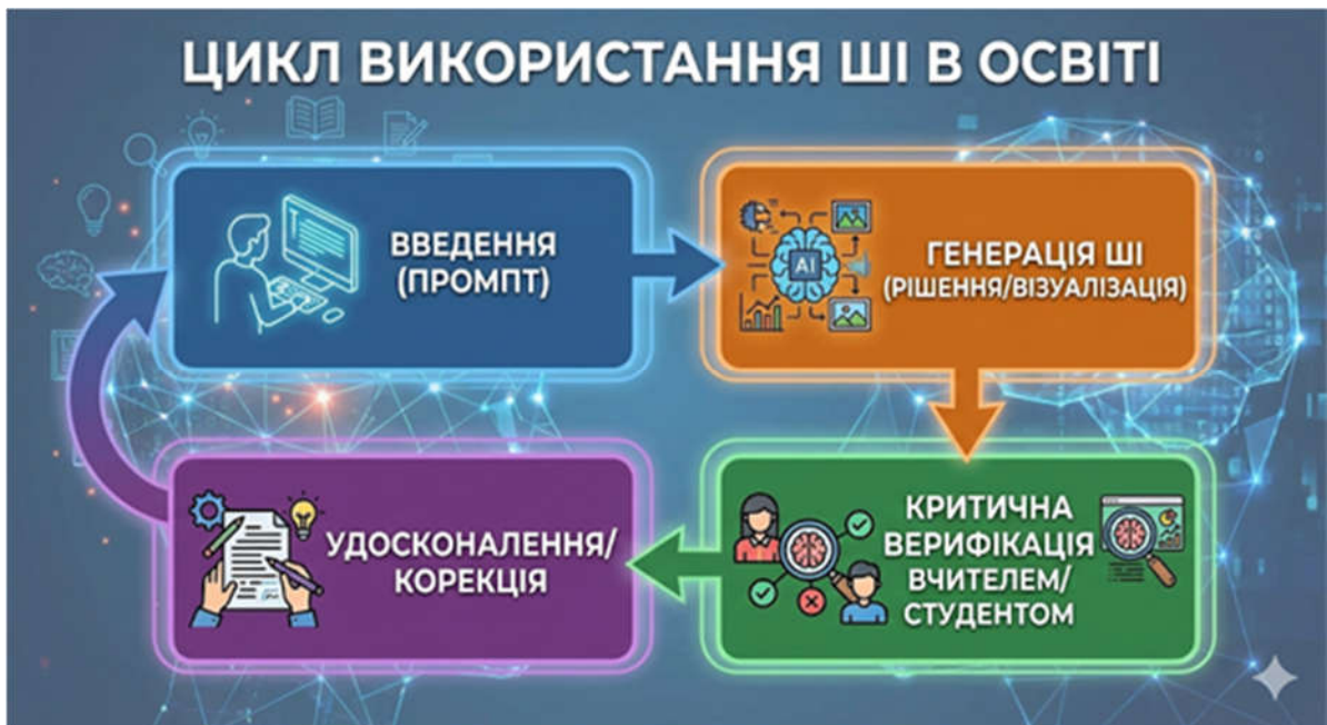
Рис. 2 Цикл використання ШІ в освіті

Розглянемо розробку практичного заняття для майбутніх вчителів математики на прикладі теми «Площа бічної поверхні піраміди».