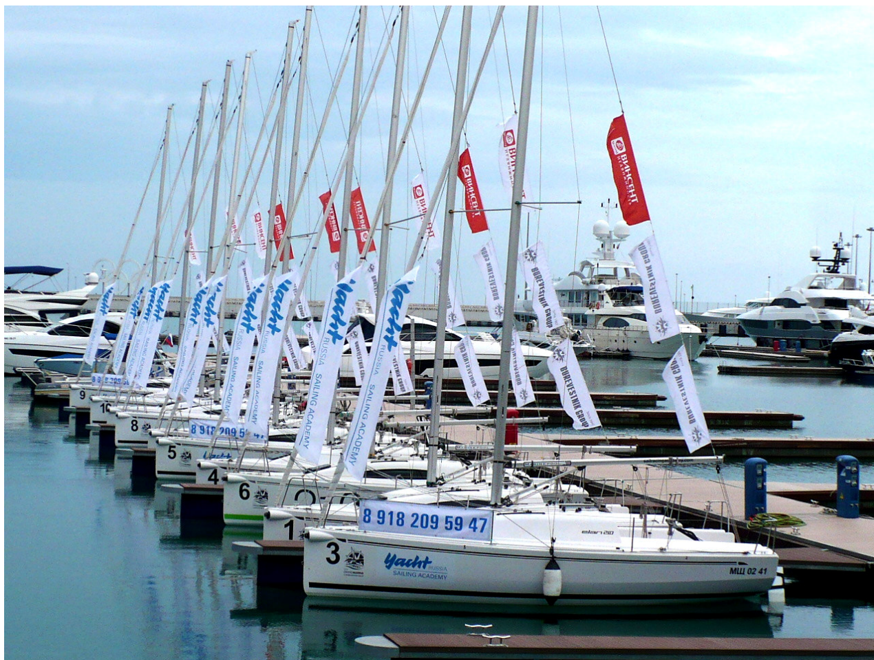
Рис. 2. Килевые яхты «ELAN 210» в яхтенном порту города Сочи