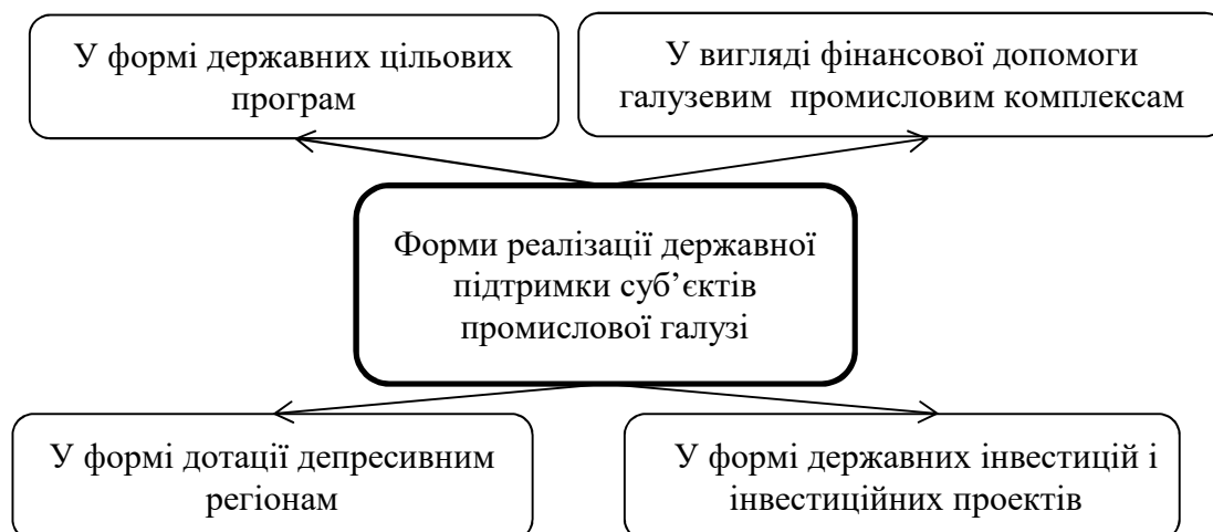
Рисунок 2 – Форми державної підтримки суб'єктів промислової галузі Примітка: побудовано автором на основі [2]

зайнятості, реструктуризація потенціалу території. На рис. 2 представлені основні форми здійснення державної підтримки промисловості.