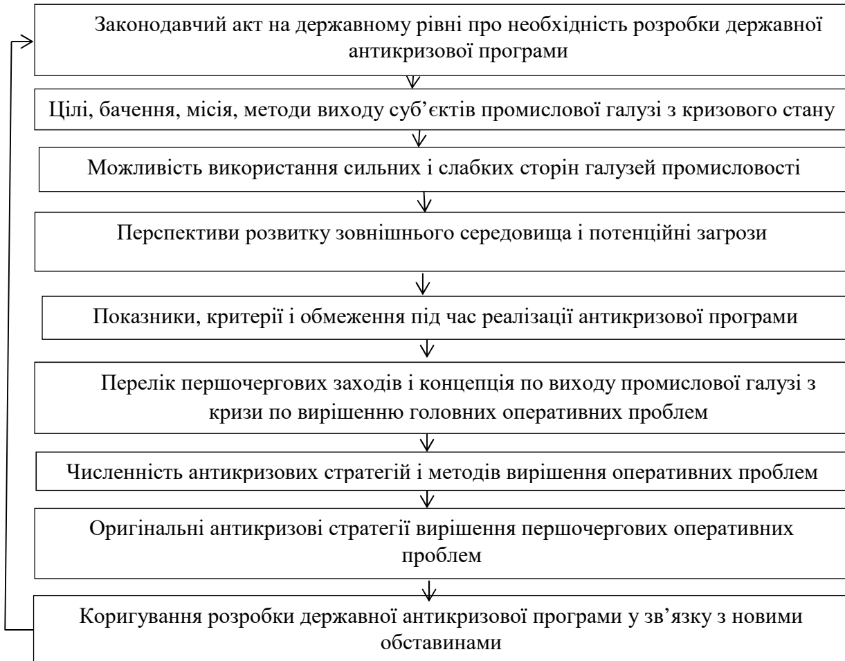
Рисунок 3 – Елементи, що визначають замкнутий цикл процесу розробки державної антикризової програми

З рис. 3 достатньо ясно видно елементи державної антикризової програми і їх циклічний характер. Підсумком формування державної антикризової програми буде заключний вибір першорядних антикризових заходів, пов'язаних з розвитком ключових точок соціально-економічного розвитку, які забезпечать вихід області з кризового стану і перехід його на стабільну траєкторію підйому економіки.