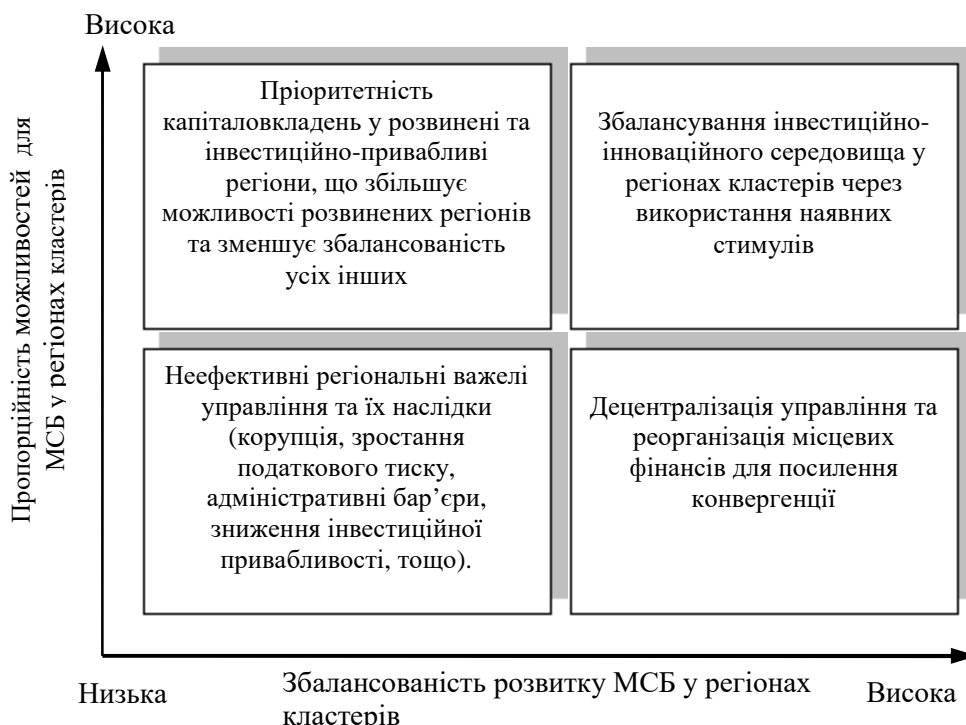
Рис. 2. Стратегічна координатна площина конвергенції регіонів [3]

Наведені в дослідженні цілі, завдання та методи сприяють урівноваженню економічних відносин між регіонами, збалансування рівня економічного й соціального розвитку та посилюють конвергенцію. Враховуючи наявні можливості кожного регіону в кластері, а також їх збалансованість розвитку, можна визначити необхідні шляхи щодо вирішення певних проблем. Пропонуємо розглянути координатну площину конвергенції регіонів на рисунку 2.