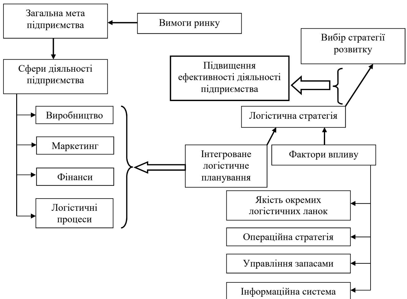
Рисунок 2 – Модель формування логістичної стратегії підприємства

Враховуючи все вище зазначене, можна запропонувати загальну модель формування логістичної стратегії виробничого підприємства, яка стане основою вибору стратегії розвитку та зможе допомогти збалансувати його діяльність (рис. 2).