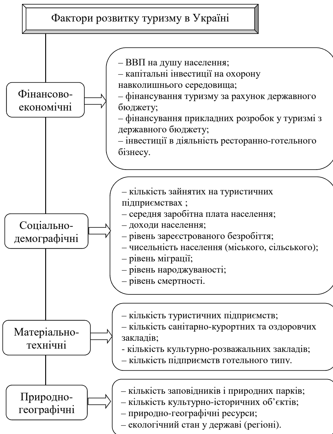
Рисунок 2– Узагальнені кількісні фактори розвитку туристичної галузі

Реконструкція та збереження заповідних та природних парків, архітектурних пам'яток, пам'яток історії та культури також сприяють збільшенню як внутрішнього так і зовнішнього туризму. Кожна країна, народ є носіями культурно-історичних цінностей, національних традицій, які також мають неабиякий вплив на розвиток туризму. Історико-культурна спадщина для туризму має особливо велике значення, а перераховані вище фактори зумовлюють вибір туристами того чи іншого регіону для відвідування.