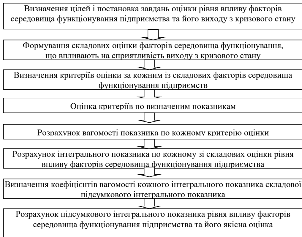
Рис. 2. Етапи визначення підсумкового інтегрального показника рівня впливу факторів середовища функціонування підприємства

b_i – вагомість i -й складової оцінки рівня впливу факторів середовища функціонування підприємства.