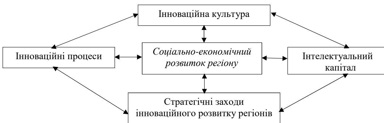
Рис. 1. Взаємовплив соціально-економічного розвитку регіонів та інноваційного процесу

- запровадження програм щодо стимулювання розвитку малих інноваційних підприємств.