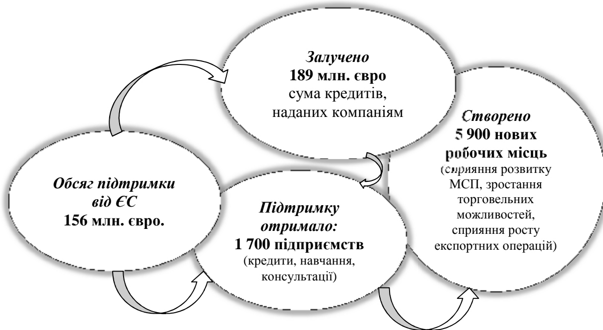
Рис. 3. Результати впровадження ініціативи «EU4Business» в Україні за період 2009-2017 рр. [6].

На рис. 3 представлено результати впровадження ініціативи «EU4Business» за період 2009-2017 рр.