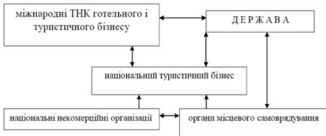
Рис. 3. Схема державного регулювання туризму

Ринок туристичних послуг на регіональному рівні формується під впливом різних політичних та економічних чинників країни. Тому, саме держава має сприяти розвитку туризму на мікрорівні. Розглянемо схему взаємодії всіх суб'єктів ринка туристичних послуг.