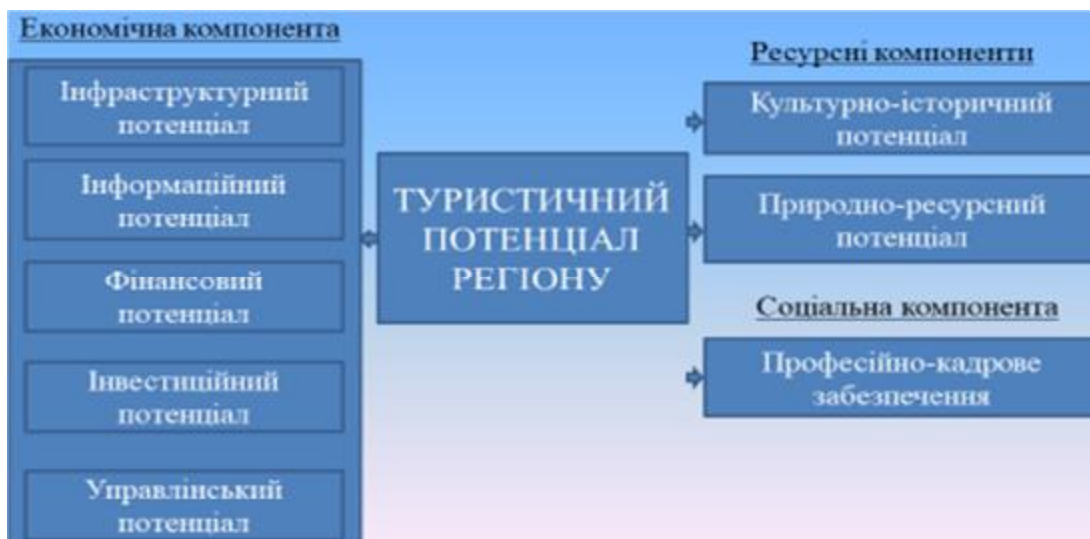
Рис. 2. Складові туристичному потенціалу регіону

Туристичний потенціал регіону – це наявність певних можливостей та ресурсів, які можуть бути використані для розвитку туристичної та рекреаційної діяльності.