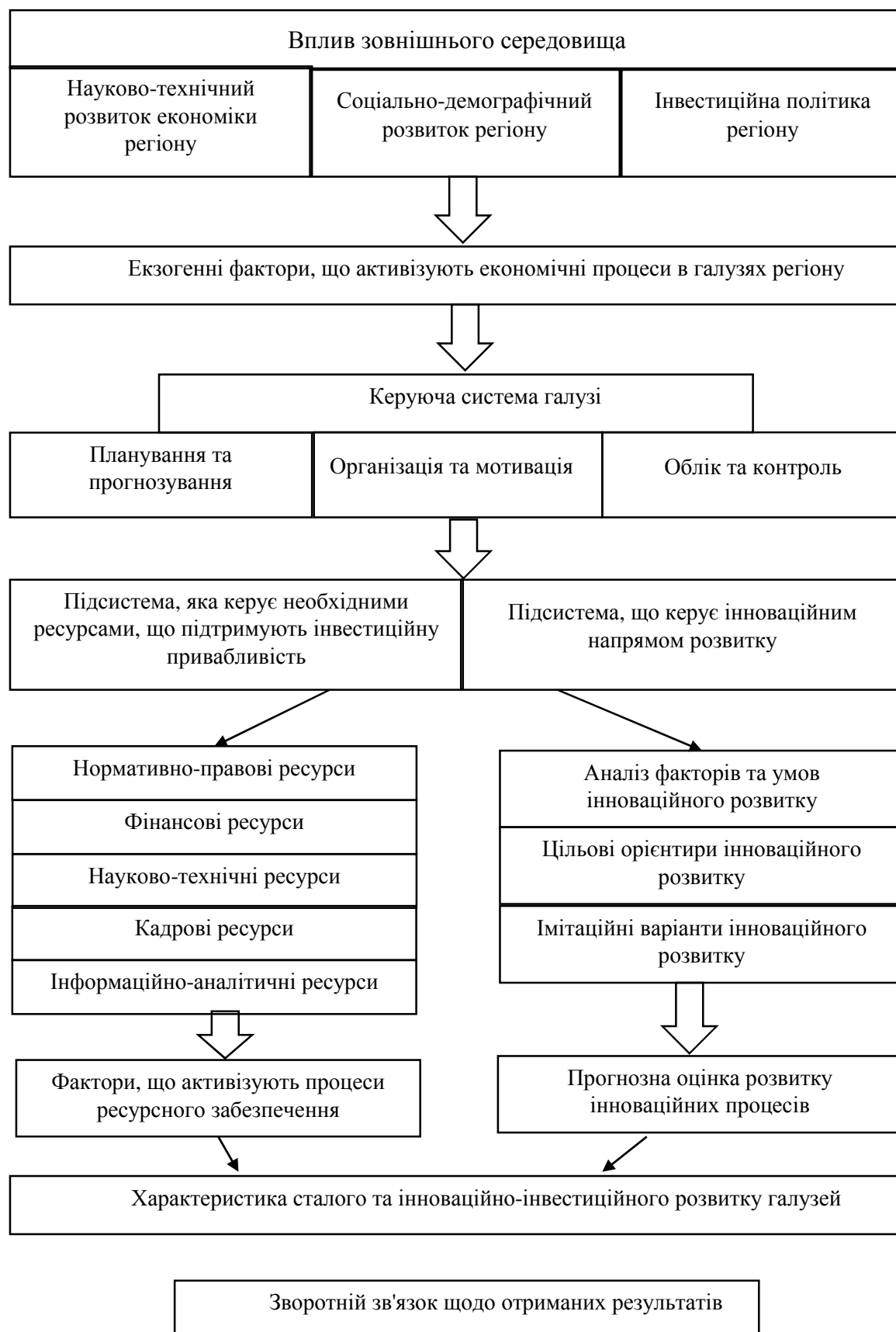
Рис. 1. Модель управління розвитком процесів розміщення підприємств

Впровадження в управлінську діяльність сучасних інтелектуальних, інформаційних та інших досягнень забезпечує повноту керованості процесів, створює можливості для їх моделювання, проведення глибокого аналізу і прогнозування. Всі позитивні зміни повинні відображатися в стані об'єкта управління, який веде до досягнення поставленої мети, дає