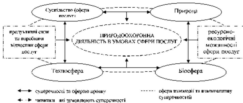
Рис. 1. Організація природоохоронних процесів в умовах обслуговуючих підприємства на інноваційних засадах

Основними чинниками посилення екологічної кризи є: кількісне та якісне нарощування продуктивних сил суспільства; розвиток науково-технічного прогресу без урахування екологічних вимог; планування моделі ресурсномісткого, еколого-деструктивного економічного зростання з орієнтацією на збільшення обсягів споживання матеріальних благ; зростання чисельності народонаселення; стихійна антиекологічна урбанізація; мілітаризація національних економік, нарощування потужностей сфери послуг у зв'язку з розвитком інфраструктури (рис. 1).