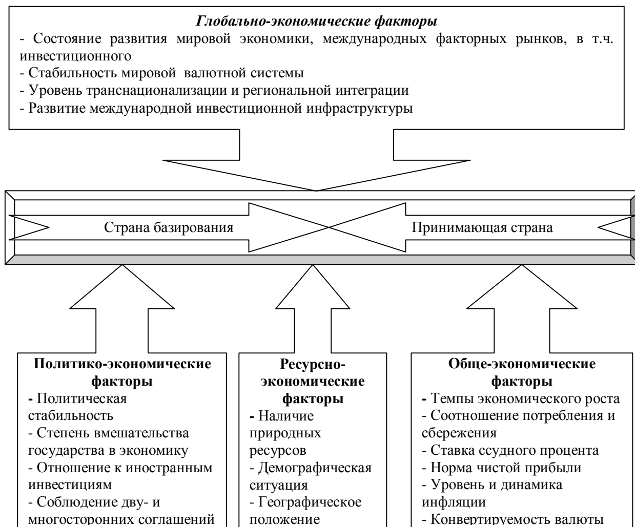
Рис. 1. - Основные факторы инвестиционной привлекательности страны [1].

Согласно статистических данных ЮНКТАД, несмотря на нестабильность развития мировой экономики, общемировой показатель объема прямых иностранных инвестиций в 2011 г. вырос на 17% и достиг 1,5 трлн. долл. США, превысив докризисный показатель [3]. Наряду с этим к докризисному уровню также вернулись глобальное промышленное производство и торговля.