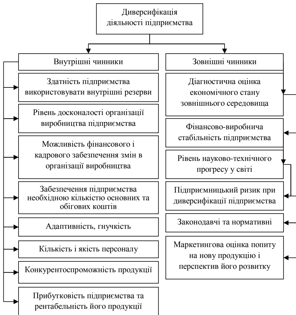
Рис. 2. - Внутрішні і зовнішні чинники диверсифікації машинобудівного підприємства