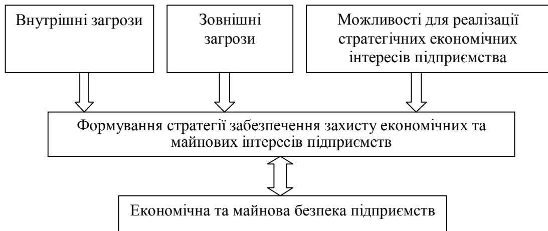
Рис. 4. - Модель формування економічного взаємозв'язку між стратегічними економічними інтересами підприємства та забезпеченням його економічної та майнової безпеки

Трактуючи зміст економічної безпеки підприємства, основою якої є реалізація стратегії його розвитку, використовуючи можливості зовнішнього середовища з застосуванням продуктивної взаємодії з суб'єктами зовнішнього та внутрішнього середовища, можна запропонувати модель для розгляду взаємозв'язку між стратегічними економічними інтересами підприємства та забезпеченням його економічної безпеки (рис. 4).