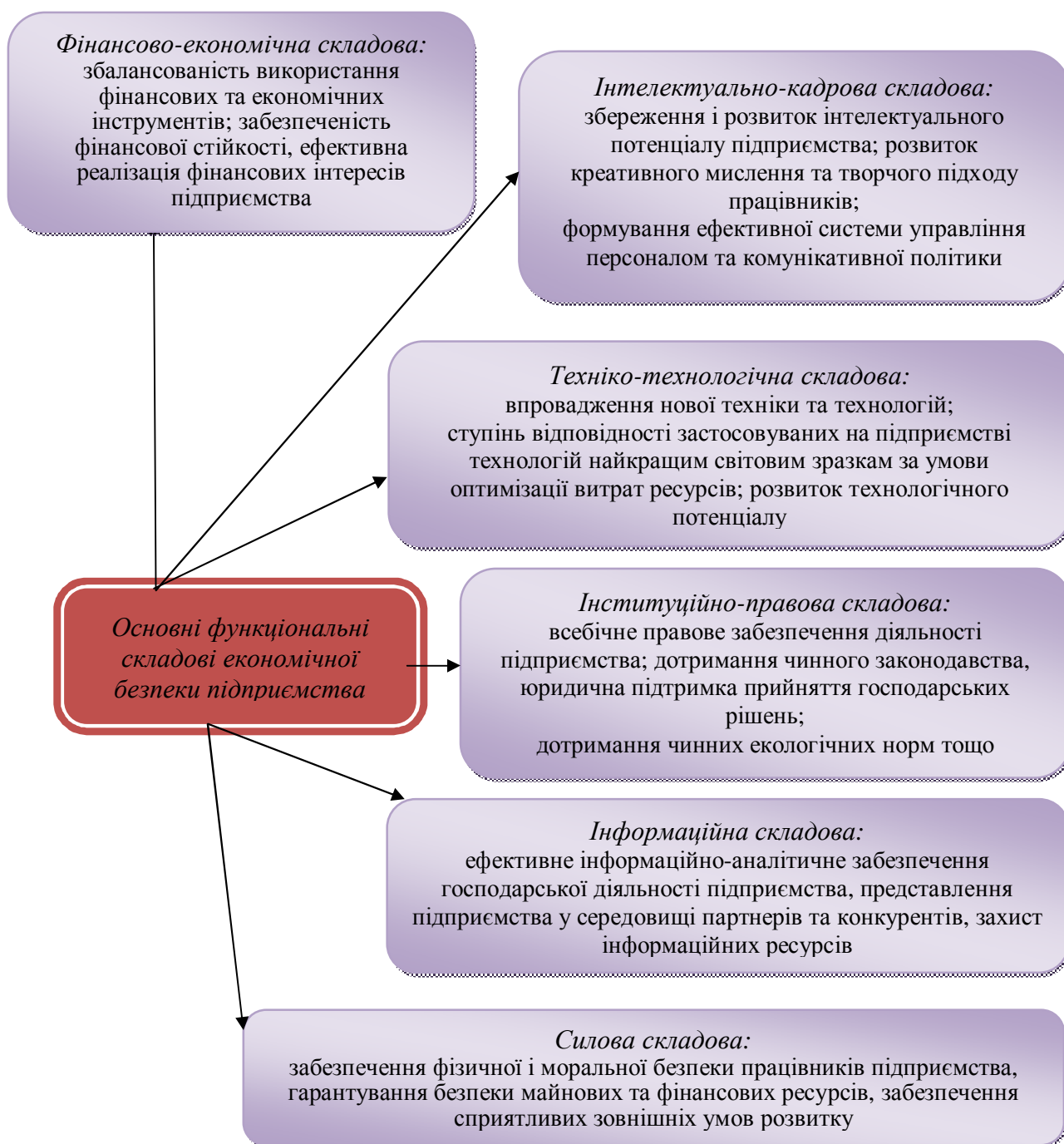
Рис. 2. - Структура та функції основних складових економічної безпеки підприємства.

вимагає копійкої повсякденної роботи відповідного персоналу, служби безпеки підприємства, які б організували його беззбиткову роботу, збереження майна, недопущення розголошення таємниці, припинення чинників насильних злочинів, збереження інтелектуальної власності тощо.