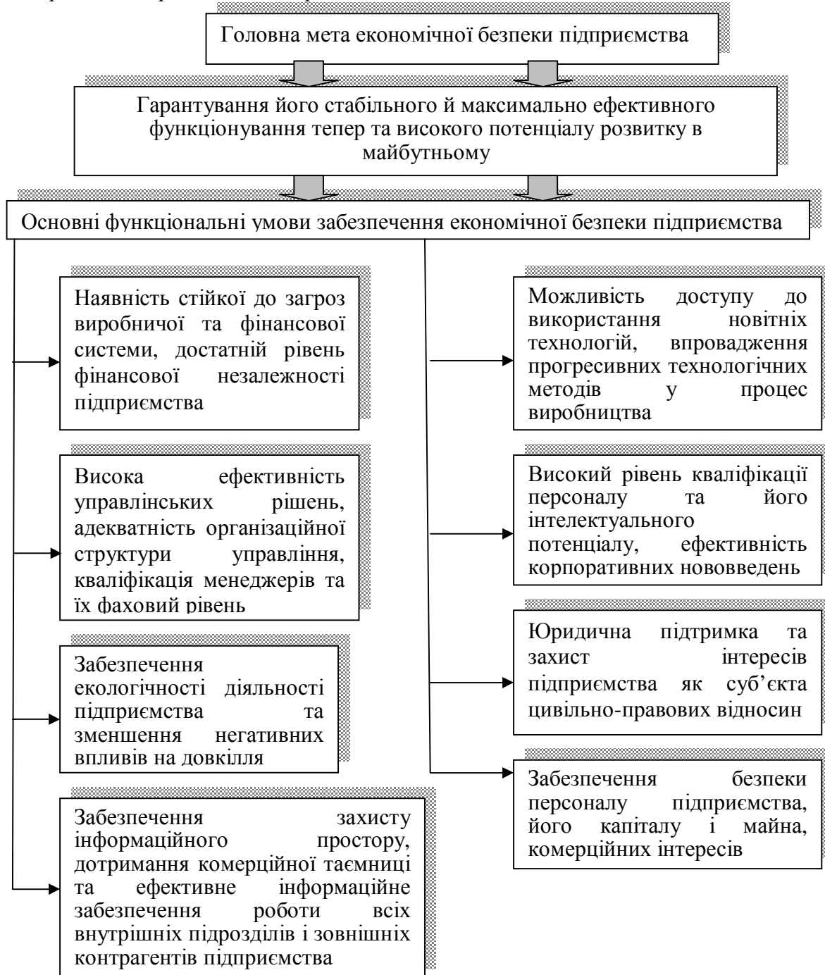
Рис. 3. - Мета й функціональні умови забезпечення економічної безпеки підприємства.

Головна мета й функціональні умови забезпечення економічної безпеки підприємства представлені на рис. 3.