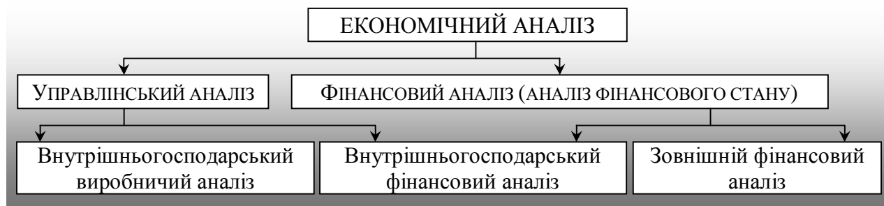
Рис 1. - Місце фінансового аналізу в системі економічного аналізу підприємств

Розвиток ринкової економіки породжує потребу в диференціації економічного аналізу на внутрішній – управлінський і зовнішній – фінансовий аналіз, який є складовою частиною економічного аналізу (рис. 1, табл. 1) [13]. Економічний аналіз являє собою процес діагностики стану підприємства з метою виявлення недоліків і резервів, вироблення рекомендацій для прийняття управлінських рішень. Аналіз фінансово-економічної діяльності підприємства дає змогу дослідити загальний господарський стан і тенденції розвитку фірми на основі виявлення взаємозалежностей між різними фінансовими показниками.