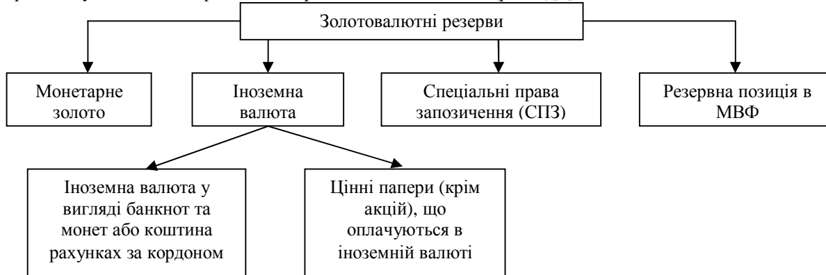
Рис. 1. Типова структура золотовалютних резервів

У сучасних умовах структура офіційних золотовалютних резервів, що формуються банками більшістю країн світу, включає як правило, чотири основні компоненти (рис. 1)[6].