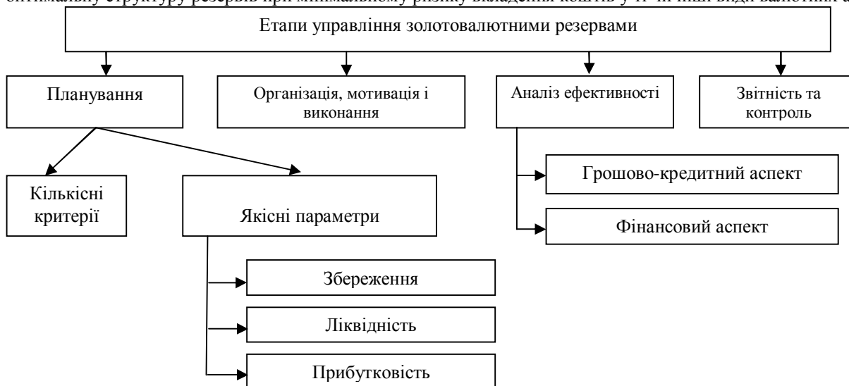
Рис. 2. Етапи управління золотовалютними резервами [3]

Для забезпечення ефективного планування золотовалютних резервів центрального банку необхідно розташовувати систему показників, які відображали б: кількість золотовалютних резервів, тобто відповідність обсягу резервів центрального банку потребам у них та якість золотовалютних резервів, що відображає оптимальну структуру резервів при мінімальному ризику вкладення коштів у ті чи інші види валютних активів.