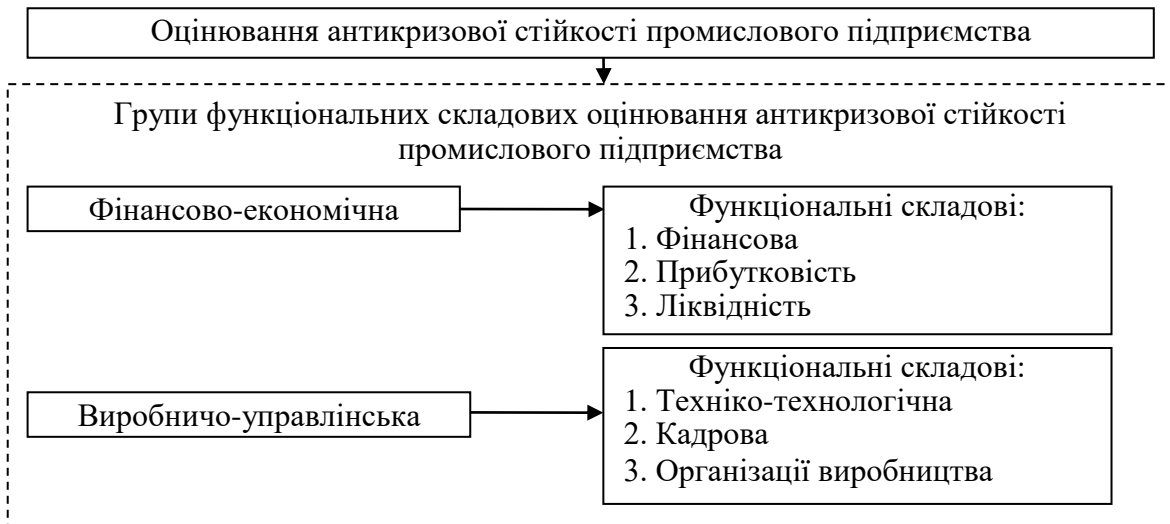
Рисунок 2 – Рекомендовані групи для оцінювання антикризової стійкості промислового підприємства за функціональними складовими

До фінансово-економічної групи нами пропонується віднести наступні функціональні складові – фінансова, прибутковість, ліквідність, але необхідно уточнити їх змістовність і визначити систему показників для оцінювання антикризової стійкості промислового підприємства. На відміну від розглянутих методик [1-9, 17-23 та ін.] нами пропонується враховувати досягнутий рівень виконання управлінських функцій, які знаходять відображення в управлінській діяльності підприємства через інтеграцію основних функцій менеджменту (організація, планування, мотивування, контроль, координація і регулювання) і реалізуються через управлінські рішення для забезпечення антикризової стійкості суб'єкту господарювання. Оскільки процесний підхід управління організацією не є протиставленням функціональному, а функції і процеси не можуть існувати окремо. Аналіз раніше розглянутих трьох напрямів оцінювання стійкості підприємства доводить, що саме ресурсно-управлінський напрям є найбільш досконалим і відповідає вимогам часу, тому пропонується при оцінці АСП враховувати рівень використання ресурсного потенціалу конкретного промислового підприємства та якість його управлінської діяльності за відібраними для цього показниками. Тому замість виробничо-технічної пропонується об'єднати техніко-технологічну, кадрову і функціональну складову організації виробництва у виробничо-управлінську групу (рис. 2).