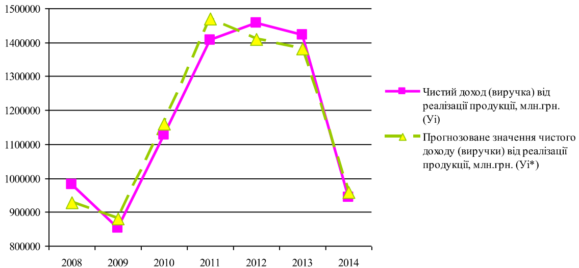
Рисунок 2 – Порівняння емпіричних і теоретичних показників регресійної моделі

За даними рисунку 2 видно, що емпіричні і теоретичні значення досить близькі. Графіки залежностей Y_i , Y_i^* , побудовані на діаграмі, підтверджують майже повний збіг емпіричних і теоретичних значень побудованої економетричної моделі.