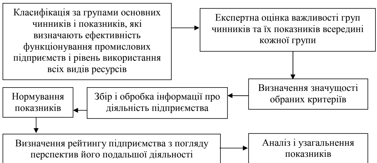
Рисунок 2 – Послідовність розв'язання проблем оцінки ефективності функціонування промислових підприємств

Слід зазначити, що оцінка ефективності функціонування промислових підприємств та їх фінансово-економічна діагностика потребують чітких методологічних підходів, які зараз відсутні. Тому необхідна комплексна, оптимально збалансована система показників, яка була б здатна відобразити всі аспекти діяльності підприємства. Необхідно застосовувати методи, які дозволяють встановити не тільки кількісні, але й якісні зв'язки між окремими елементами ефективного функціонування промислових підприємств. Крім того, важливим показником є рівень розвитку і конкурентоспроможності цього потенціалу. На основі цих показників можна здійснити своєчасне обґрунтування і реалізацію управлінських рішень відносно подальшої діяльності підприємства, спрямованої на розвиток профілів його діяльності. Оцінка ефективності функціонування промислових підприємств є багатокритеріальним і досить складним завданням, послідовність розв'язання якого схематично подано на рис. 2.