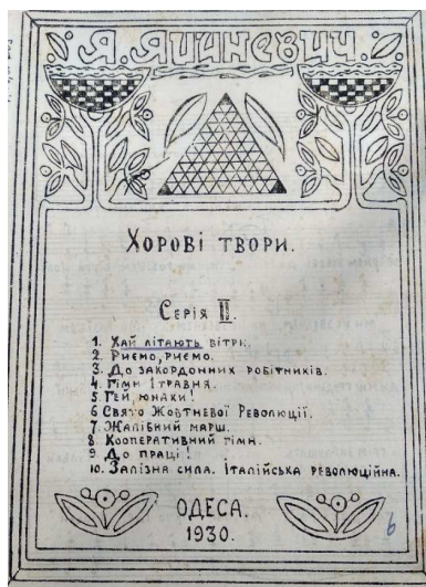
Ілюстрація 1. Титульні сторінки «Хорових творів» Я. Яциневича (перша і друга серії) [ІР НБУВ. Ф. 45. Спр. 204. Арк. 1. Спр 205. Арк. 1].