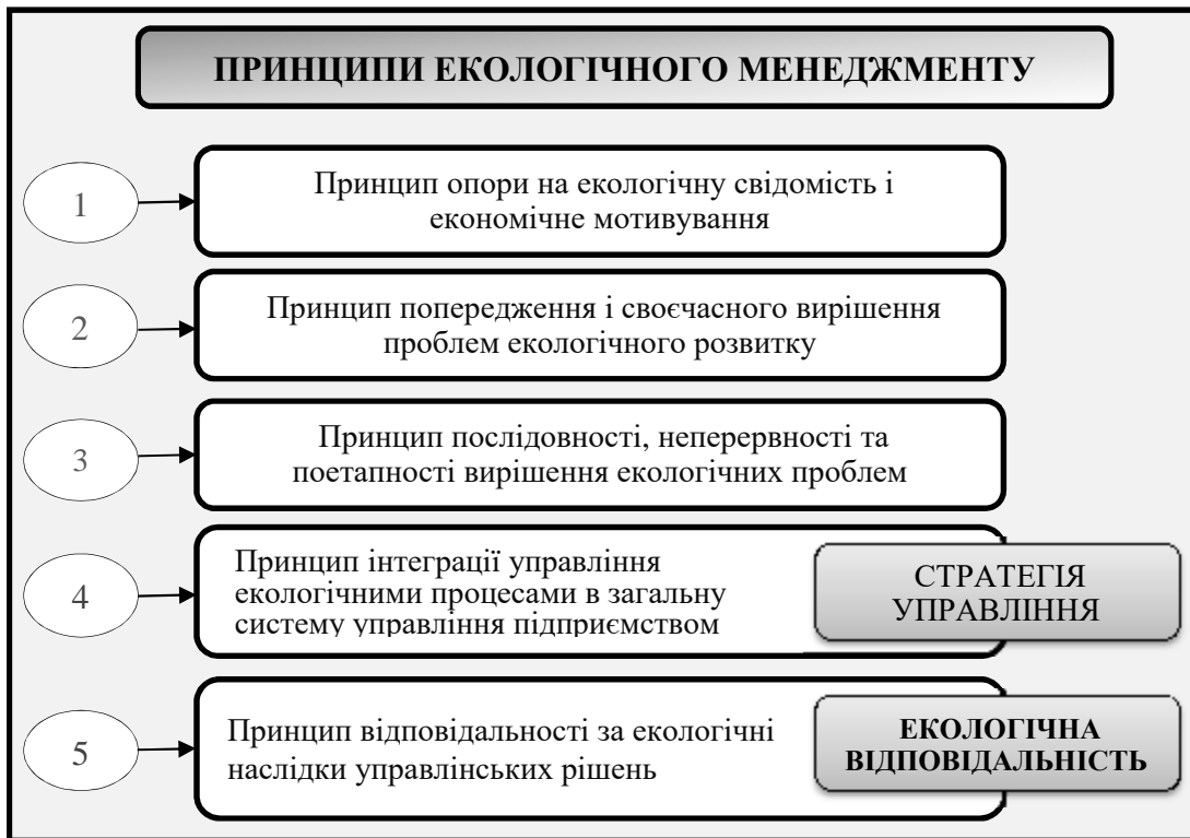
Рис. 1. Визначення принципів екологічного менеджменту з проявом екологічної відповідальності

З урахуванням вищевикладеного, повернемося до проблеми екологічної відповідальності підприємства. До теперішнього часу сформувався ряд концептуальних підходів і створюваних на їх основі механізмів та інструментів її реалізації. Представлений нижче перелік цих підходів у цілому відображає еволюцію змісту й інструментів реалізації екологічної відповідальності: