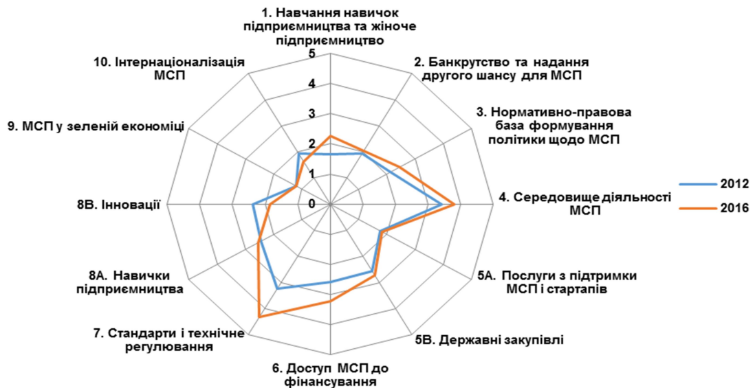
Рис. 4. Індекс економічної політики у сфері МСП в Україні (2012, 2016) [6,7]

По-друге, навіть порівнюючи з попередньою оцінкою по регіону, Україна відстає майже за всіма показниками (табл. 2), в той час, як Грузія – лідер у регіоні, а друге місце посідає Вірменія. Україна посідає перше місце лише за одним з дванадцяти показників: стандарти і технічне регулювання.[7]