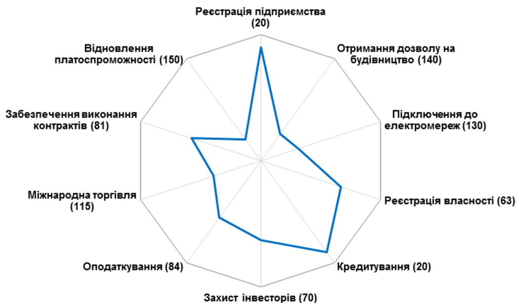
Рис. 3. Позиції України за основними пунктами рейтингу «Ведення бізнесу» [6, 7].

На рис. 3 представлено позиції України за основними пунктами рейтингу «Ведення бізнесу», де бачимо, що проблемними питаннями є відновлення платоспроможності, отримання дозволу на будівництво, підключення до електромереж, а позитивними є легка реєстрація підприємства та кредитування.