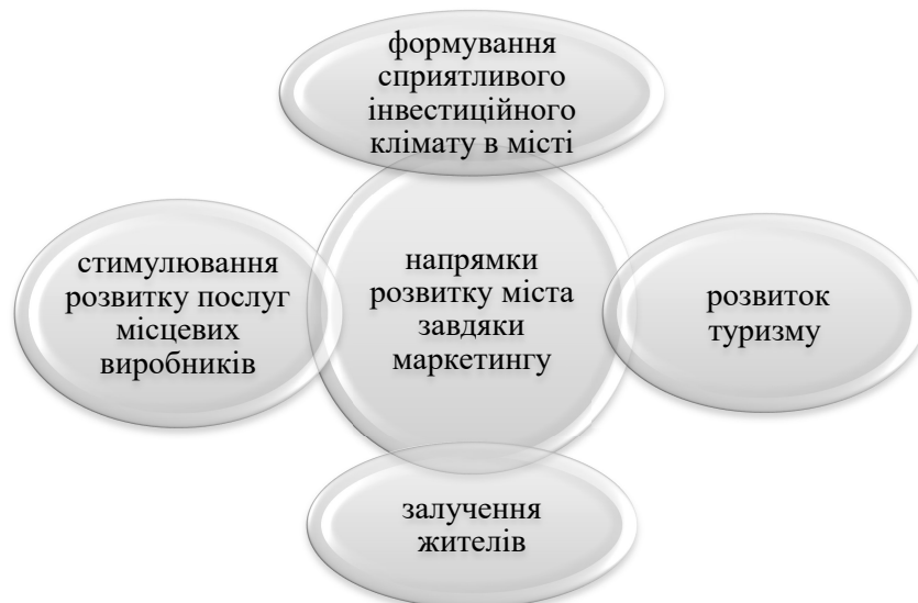
Рис. 1. Напрямки розвитку міста завдяки маркетингу (складено авторами)

Міський маркетинг або маркетинг територій з'являється через зростаючий тиск конкуренції, зміни в соціальних цінностях, зміни в демографічних умовах тощо. Основною метою міського маркетингу є прогрес та розвиток міста, його економічні, соціальні, екологічні чи культурні умови, спілкування та співпраця з усіма відповідними суб'єктами державної, приватної та некомерційної галузі. Важливою опорою міського маркетингу є економічний, соціальний, культурний та фізичний розвиток міста, тобто здатність спілкуватися та співпрацювати з усіма відповідними учасниками, такими як підприємства, компанії, місцеві політики, міська адміністрація, спілки, асоціації, некомерційні організації, культурні та релігійні установи тощо. Задля успішного розвитку міста, йому потрібен постійний прилив капіталу. Буде такий приплив або ні, який характер він буде носити і який буде його економічний ефект - все це залежить від безлічі різноманітних факторів, з яких складається інвестиційний клімат міста. І діяльність місцевої влади щодо залучення інвестицій полягає, по суті, тільки в одному - в поліпшенні параметрів інвестиційного клімату, на які можна впливати управлінськими діями.