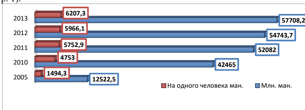
Диаграмма 1. ВВП

Таким образом, туризм, являясь выгодной отраслью экономики, может стать при соответствующих условиях важнейшей статьёй валового внутреннего дохода АР (диагр. 1).