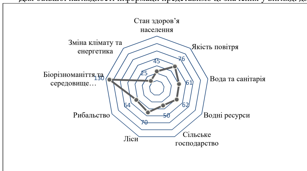
Рис. 2. Позиції України за критеріями ефективності у 2016 році

Для більшої наглядності інформації представимо ці значення у вигляді діаграми.