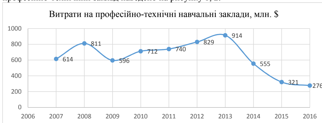
Рис 1. Витрати на ПТНЗ, млн. долл. США

На сьогоднішній день, коли більше половини громадян працездатного віку має вищу освіту, найвищим попитом на ринку праці користуються ті, хто вміє виробляти, будувати, шити, лагодити і куховарити. А ці робочі професії стосуються саме професійно-технічної освіти. [4]. Таке галузеве розуміння міністерства освіти звужує сприйняття професійно-технічної освіти лише до галузевих робітничих професій. Отже є сенс провести більш детальний аналіз витрат саме на професійно-технічні заклади. Динаміку витрат на професійно-технічні заклади, а також витрати в середньому на один професійно-технічний заклад наведено на рисунку 1, 2.