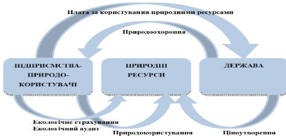
Рис. 1. Сучасний механізм використання природних ресурсів [1]

Нераціональне використання природних ресурсів «веде до їх виснаження; погіршення якісних характеристик у результаті експлуатації. Відбувається зниження родючості земель, деградація і знищення лісів, порушення режиму водних систем та їх забруднення, трансформація рельєфу» [1].