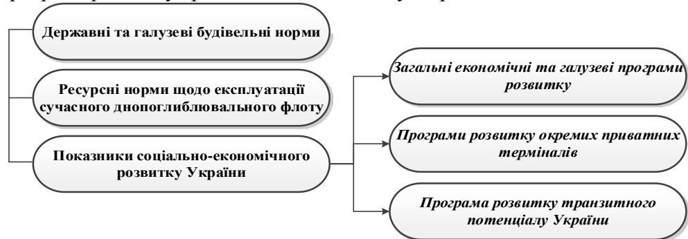
Рис. 2. Блок інноваційного механізму «Формування бюджету – складової тарифу / Загальна інформація» (авторська розробка)

У третьому блоку інноваційного механізму тарифоутворення «База розподілу та преференції / Загальна інформація» (рис. 2) авторами наукової роботи включені такі обов'язкові елементи як: