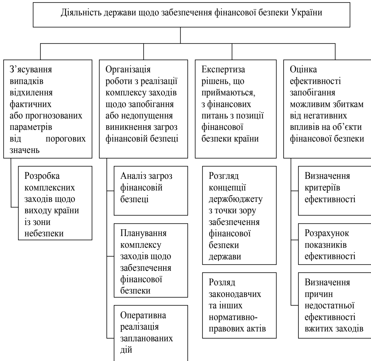
Рис. 2 – Напрями діяльності держави щодо забезпечення фінансової безпеки держави

довгострокових залучень реального сектору економіки; удосконалення системи бюджетної статистики та діагностики у системному аналізі з індикаторами грошово-кредитної, боргової та валютної безпеки; розробка поетапної стратегії скорочення бюджетного дефіциту за рахунок нарощення власного доходного потенціалу, підвищення рівня управління державним боргом шляхом реалізації сучасної стратегії залучення позичкового капіталу, інвентаризації та класифікації всіх боргів, трансформації структури боргу, недопущення практики прийняття виключних рішень, не підпорядкованих єдиній борговій політиці, ліквідація прихованого дефіциту.