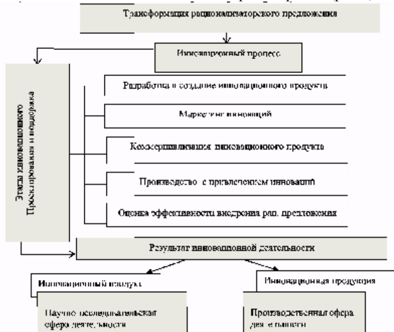
Рис. 3. Трансформация рационализаторского предложения в инновационный продукт (сгруппировано авторами)

Нужно отметить, что если идея касательно новой продукции приходит от реализаторов товара, то это только частичное обновление, а если идея приходит с научно-исследовательской сферы деятельности и разработана под влиянием научно-технического прогресса, то тогда это является новым товаром на рынке (рис.3).