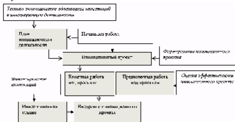
Рис. 4. Стадии инвестиционного проектирования.

Инновационный проект, который охватывает научно-исследовательские институты: разрабатывает новые идеи для товара, делает открытия, проводит научно-исследовательскую работу, является научно-исследовательским.