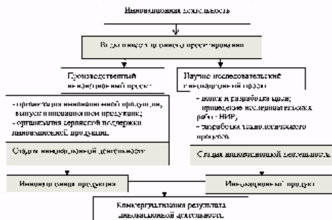
Рис. 5. Инвестиционная деятельность по видам инвестиционного проектирования.

Когда предприятие использует патентную стратегию, то нужно понимать, что данное предприятие использует все возможные объекты интеллектуальной собственности, а также разные виды ее правовой охраны и немаловажный факт это экономическая целесообразность. Такая стратегия дает возможность предприятию: на базе исследований на патентную чистоту данное предприятие может своевременно реагировать на изменение рыночной конъюнктуры; повысить маркетинговые исследования за счет научно-исследовательских и опытно-конструкторских работ и укрепить свои позиции на рынке через использование современных технологий; повысить конкурентоспособность предприятия.