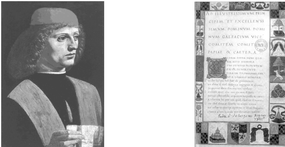
Рис. 3. Антоніо Корназано "Книга про мистецтво танцю"

Як і всі відомі тогочасні писемні пам'ятки запису танців, ця книга не містить системи нотації, яка дає змогу без участі балетмейстера відтворити описані танці.