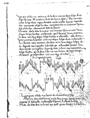
Рис. 1. Доменіко да П'яченцо "Про мистецтво танцю та вміння вести танець"

Найвідомішими учнями Д. П'яченцо, які продовжили пошуки у вирішенні проблеми нотації танців, стали Гульєльмо Ебрео да Пезаро і Антоніо Корназано.