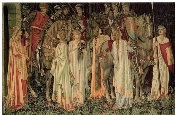
Рис. 2. Фірма «Морріс і Ко». Виступ воїнів. Е. Борн-Джонс. Шпалера з серії «Святий Грааль» [5].

вчення В. Моріса, відроджувала гобелен у Франції і в Шотландії в середині XX ст. [5].