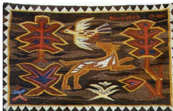
Рис. 3. С. Колос, килим «Птах і песок» 1923 р. Ручне ткацтво [7].

Мистецтво українського гобелену розпочало свій розвиток на початку XX ст. (рис.3). Митці у перші пореволюційні часи започатковують основу українського гобелену, використовуючи традиційні старовинні сюжетні композиції в створенні художніх творів.