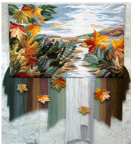
Рис. 5 Пілюгіна О. [10].

Значного поширення на даний час займають міні-гобелени. Текстильні мініатюри легко контактують з інтер'єрами житлових будинків (рис. 5, 6) [15, 138].