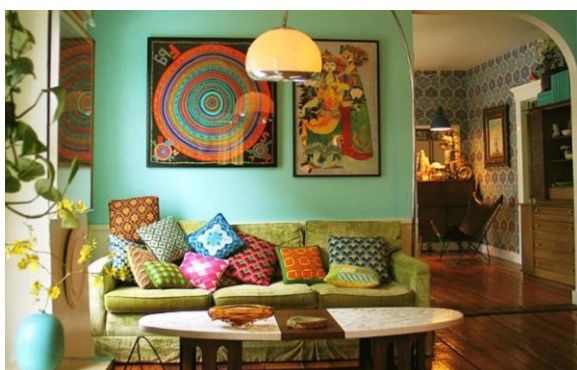
Рис. 6. Гобелени в сучасному інтер'єрі [6].

Аналізуючи такий вид декоративно-прикладного мистецтва як ткацтво гобелену, можемо зробити такі висновки: що гобелен – це окремий вид мистецтва, один із найважливіших елементів національної культури українського народу, який розвивався на ґрунті українських національних