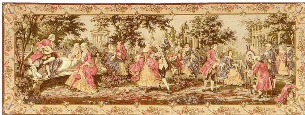
Рис. 1. Гобелен «Сади Людовика XIV». За мотивами французької школи романтичного живопису XVII ст. [9].

Походження терміну «гобелен» стало відомим в XVII ст. у Франції. В Парижі братами Гобеленами було створено першу мануфактуру, що поєднала фламандських красильників і ткачів. Саме їх прізвище і стало назвою виробам [10].