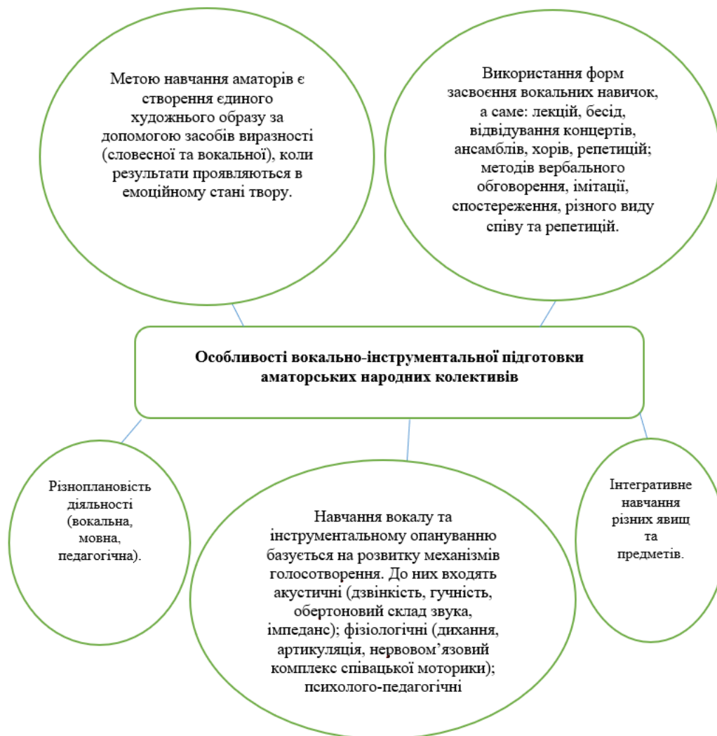
Рис. 1. Характерні риси вокальної підготовки народних колективів

виділити компетентність музикантів та їх обізнаність у сценічній культурі. Виникає чітка необхідність переосмислення усталених поглядів на культивування вокалістів під час навчального процесу, інтеграції нових технологій та підходів, переоцінки принципів, які спрямовані на перетворення аматорів на фахівців.