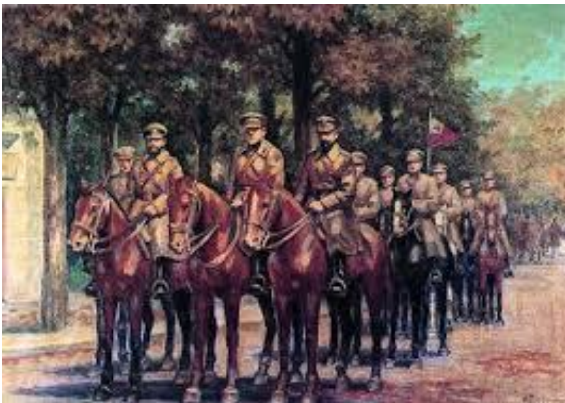
Рис. 4. 6-а Січова стрілецька дивізія УНР у Станиславові. 1919 р. Олія, 56х76 см