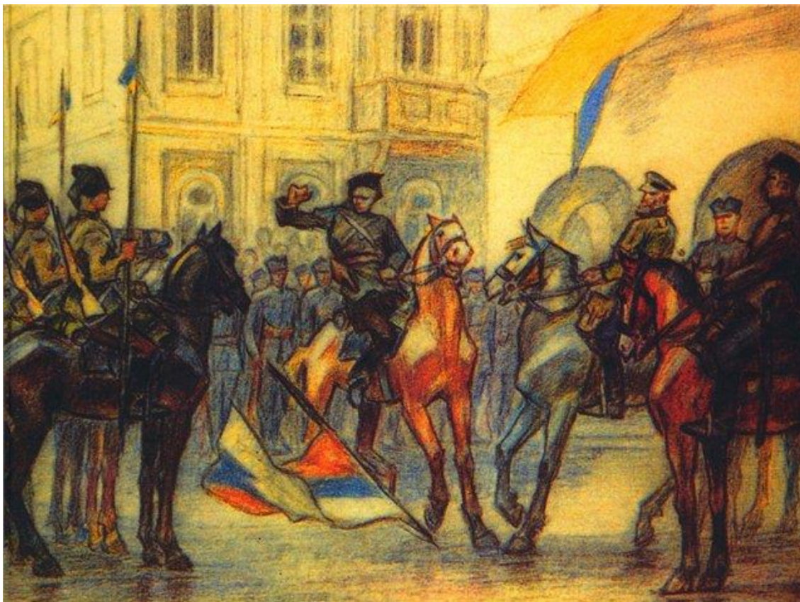
Рис. 3. У відбитому Києві чорношличники скидають з будинку Думи російський прапор. 31 липня 1919 р. Акварель, 20х26 см