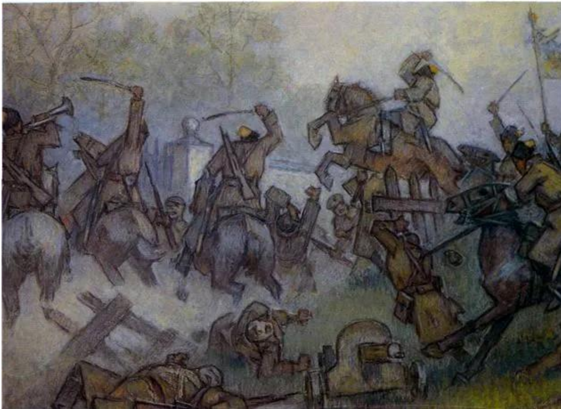
Рис. 1. Кавалерійська атака. Акварель