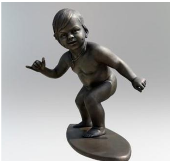
Рис. 3. Володимир Журавель, «Малюк серфер», Київ, 2021

У 2021 році у парку м. Києва, встановлено скульптуру «Малюк серфер» (Рис 3) Володимира Журавля.