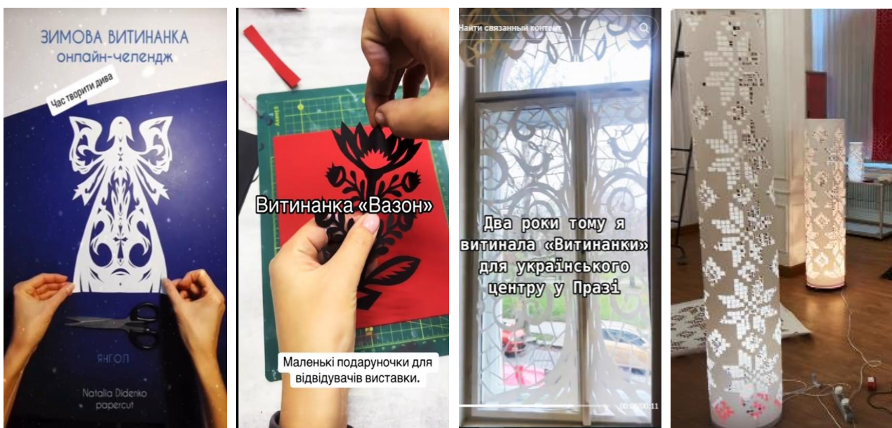
Рис. 2. Представлення дизайнерського вирішення витинанок у соціальних мережах

Цифрові технології дають змогу розширювати аудиторію для популяризації давнього декоративного мистецтва. Прикладом можуть бути дописи з презентацією стилізованих витинанок у сучасних інтер'єрах, демонстрацією вбрання з традиційними елементами, челенджі з виготовлення витинанок на певну тему (наприклад протягом семи днів створювати щоразу нову витинанку на різдвяну тематику) тощо (рис. 2).